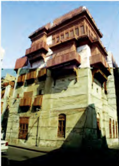
الحفاظ على الهوية أمر لا بد منه

يربط الشرق بالغرب، كما أنها مبنية على روابي صناعية مرتفعة عن مستوى الحديقة الوسطية من ٢ إلى ٧ متر. كما روعي في تصميمها خصوصية العائلة السعودية. كما سبق وطرح فلل الأميرالد التي تأخذ في طابعها أنماطا عدة منها الحديث والنجدية والماليزي والإسباني والأندلسي، وتختلف مساحات أراضيها بحيث لا تقل مساحة أرض الفيلا الواحدة عن ٩٥٠ مترا مربعا ولا تزيد على ٢٢٠٠ متر مربع، كذلك تختلف هذه الفلل في حجم مسطحات البناء حيث تراوح مسطحات مبانيتها ما بين ٧٥٠ وألفي متر مربع، كما تمتاز هذه الفلل ( الأميرالد ) بالتصميم الهندسي ذي المساقط المفتوحة والمحاكاة بامتياز طرازها المعماري وإطلالتها الرائعة على المسطحات الخضراء العامة، وتتميز أيضا كل فيلا من هذه المجموعة بخصوصية عن الجار حيث أسهم التشكيل المعماري في تكوين حديقة ومسبح تطل عليهما كافة أرجاء الفيلا التي تحتضنها طوليا ويتمتع من خلالها المجالس والغرف كافة بإطلالة مميزة، وقد تم الاستفادة من أسطح الفلل وذلك من خلال عمل بلكونات مطلة على الحدائق العامة. وقد روعي في تصميمها جميعا خصوصية العائلة السعودية، كما تمتاز بإطلالتها المميزة على المناطق الخضراء المفتوحة، وتراوح مساحات أراضيها ما بين ٩٥٠ و ١٢٠٠ متر مربع، فيما تبلغ مساحة البناء للفيلا الواحدة ٦١٤ مترا مربعا.