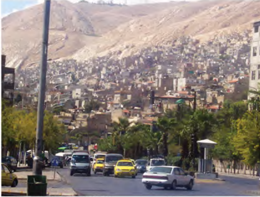
لا تكاد تخلو مدينة في العالم من العشوائية وسوء التنسيق

تعتبر مرة الرياض أحد أبرز الأمثلة على ذلك وبشهادة الكثير من المعماريين والزوار