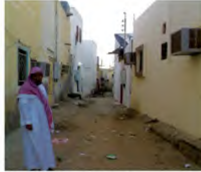
العشوائية لها نصيب من الأحياء السكنية

يأتي التلوث البصري عادة نتيجة للإهمال أو سوء التخطيط والتصميم