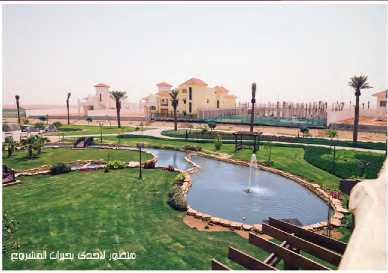
منظور لاحدى بحيرات المشروع