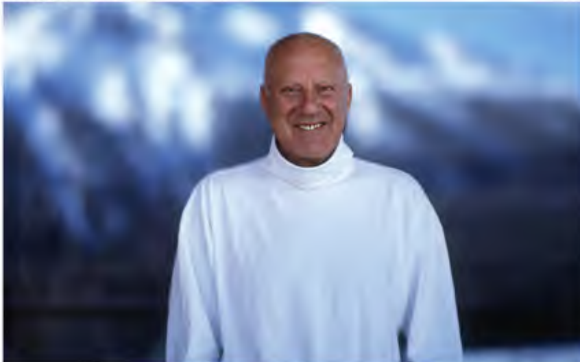
المعماري العالمي نورمان فوستر

اشتهر اللورد نورمان فوستر، البالغ من العمر ٧٢ عاماً بتصاميمه التي تثير الجدل بقدر ما تثير الإعجاب. لكن لا يشك أحد في أنه أشهر معماري في بريطانيا، ومن أشهر المماريين في العالم وأكثرهم طلباً من قبل الشركات الكبرى، لذا فإن زبائنه يأتون من مختلف بقاع الأرض. فهو الذي صمم برج الفيصلية في الرياض - السعودية، ومطار هونغ كونغ الدولي على جزيرة إصطناعية، وبرج رئاسة بنك «أتش أس بي سي» HSBC، وأبراج الترويكا الشهيرة في كوالا لامبور عاصمة ماليزيا، وجسر الألفية فوق نهر التايمز في لندن، وبرج بنك «كوميرز» في فرانكفورت، ألمانيا، وملعب «مبلي» الجديد في لندن.