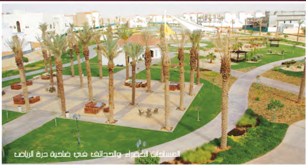
المساحات الخضراء والحدائق في ضاحية درة الرياض