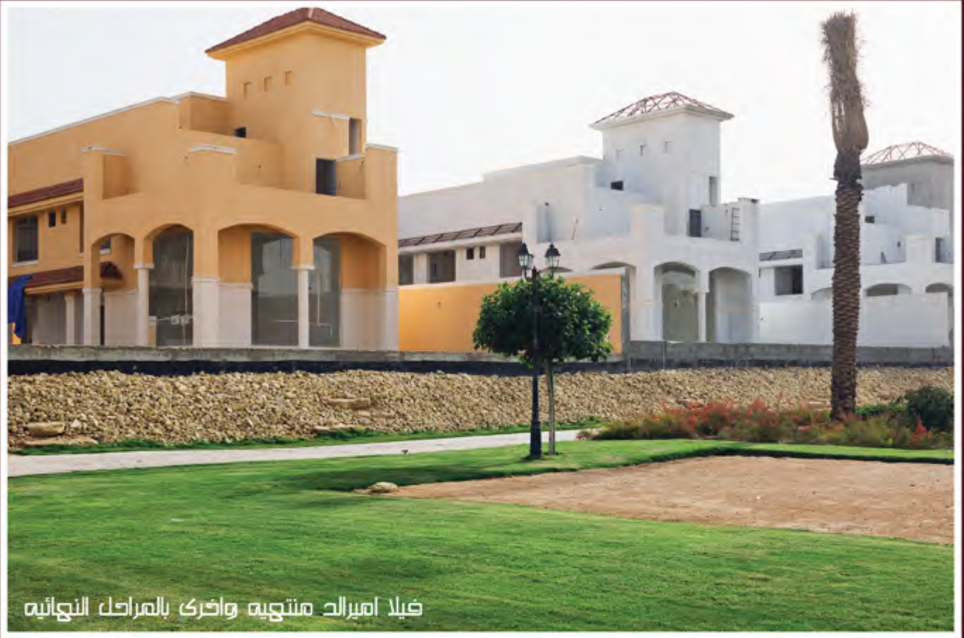
فيلا اميرالده مستجيبه واخرى بالمراكب النجائيه