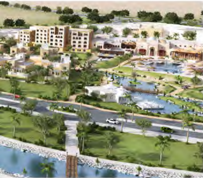
إطلالة الفندق والنادي الصحي على المساحات الخضراء.