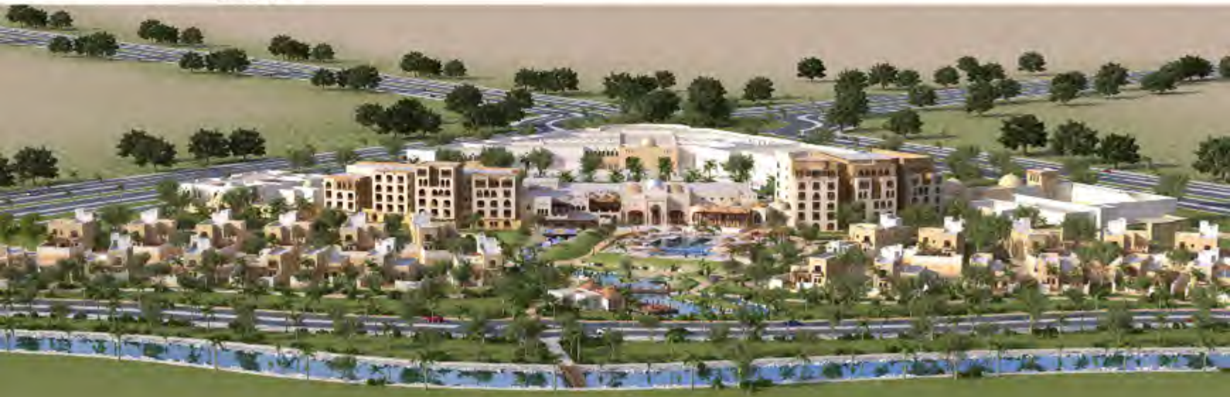
منظر عام للفندق

من حماس لفكرة المشروع المميزة والفريدة في نوعها على مستوى السعودية. الجدير بالذكر أن شركة درة الرياض للتطوير العقاري سبق أن وقعت مذكرة تفاهم مع شركة الخزامى للإدارة، لتقديم المساندة الفنية وخدمات التشغيل مع شركة روزوود للفنادق والمنتجعات العالمية لصالح فندق «درة الرياض».