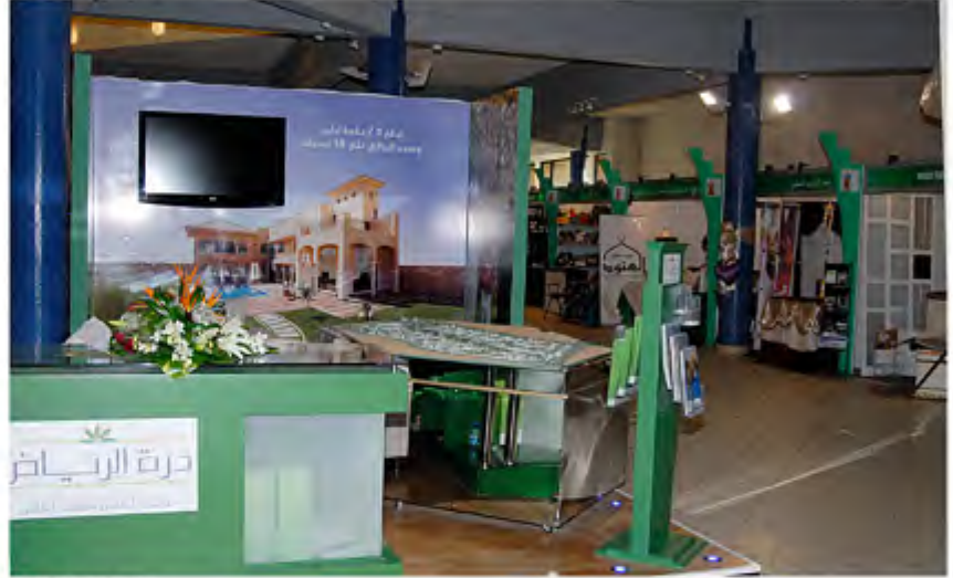
جناح درة في العرض

ويضم المهرجان، الذي يُعد بمثابة "جنادرية مصغرة"، أركاناً وأجنحة لمناطق المملكة المختلفة حيث تعرض مقتنيات أثرية تمثل مناطق القصيم ومكة المكرمة والمدينة المنورة وحائل وعسير، كما تشارك العديد من الشركات والمصانع في المهرجان ومنها أجنحة للمجوهرات والتحف والعمود الشرقية والإكسسوارات والهدايا والملابس التراثية، إلى جانب شركات العقار والسفر والسياحة وشركات التجميل والمستلزمات المنزلية.