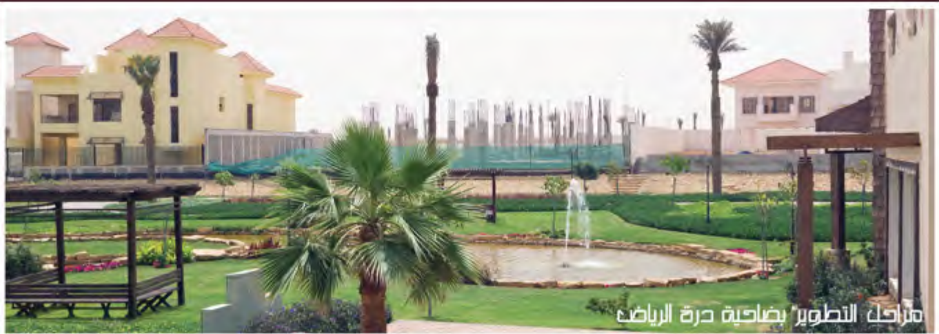
مراحل التطوير بضاحية درة الرياض