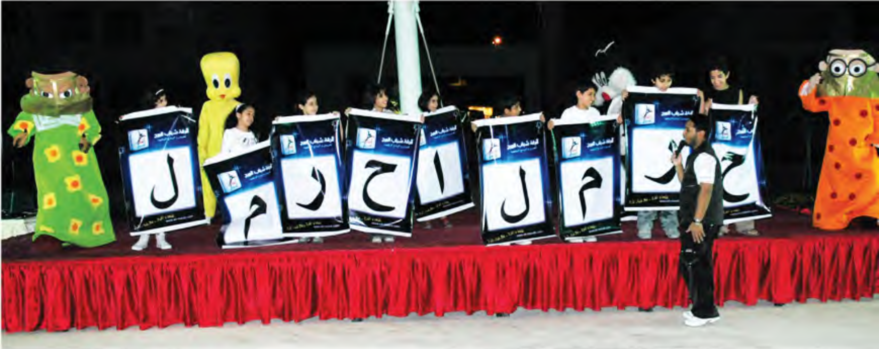
جانب من مشاركة الأطفال في المهرجان