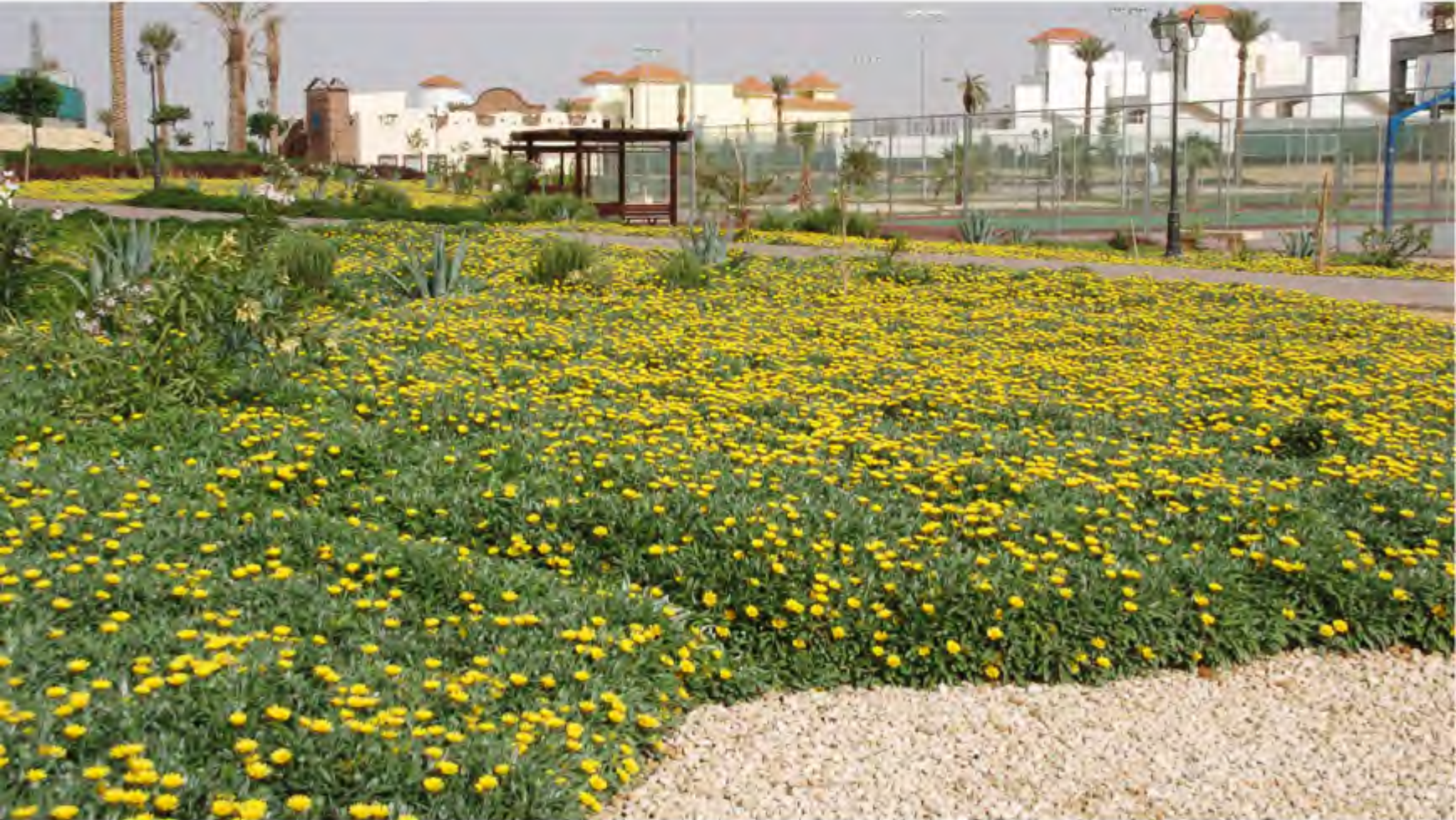
حدائق مشروع شاحبة درة الرياض

وتهدف الدراسة إلى تطوير النظام الغائم حالياً لتلك الشوارع واعطاء فرصه زيادة الأدوار وذلك للمخططات التي تم اعتمادها فقط