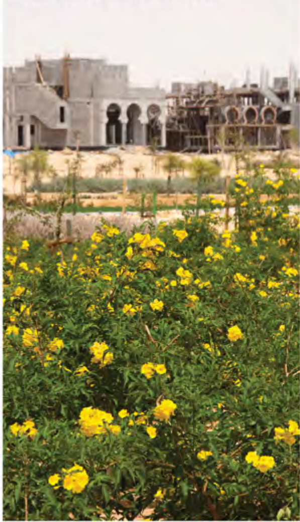
اصحاب التطوير في فلك الكادي