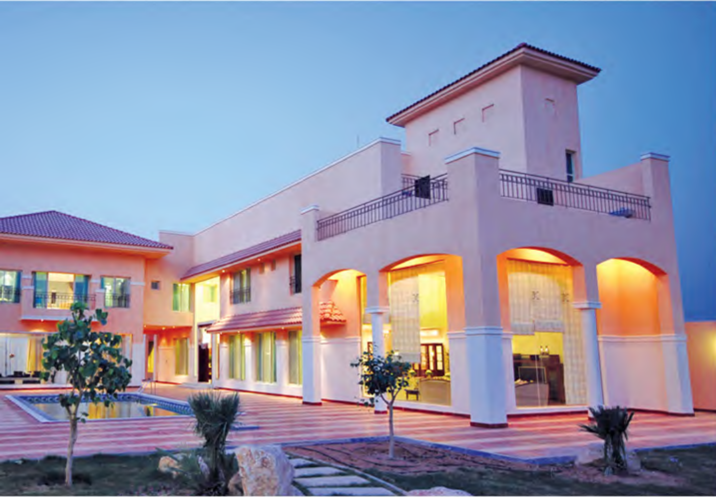
نموذج للمباني الحديثة القائمة على التنسيق الحضاري