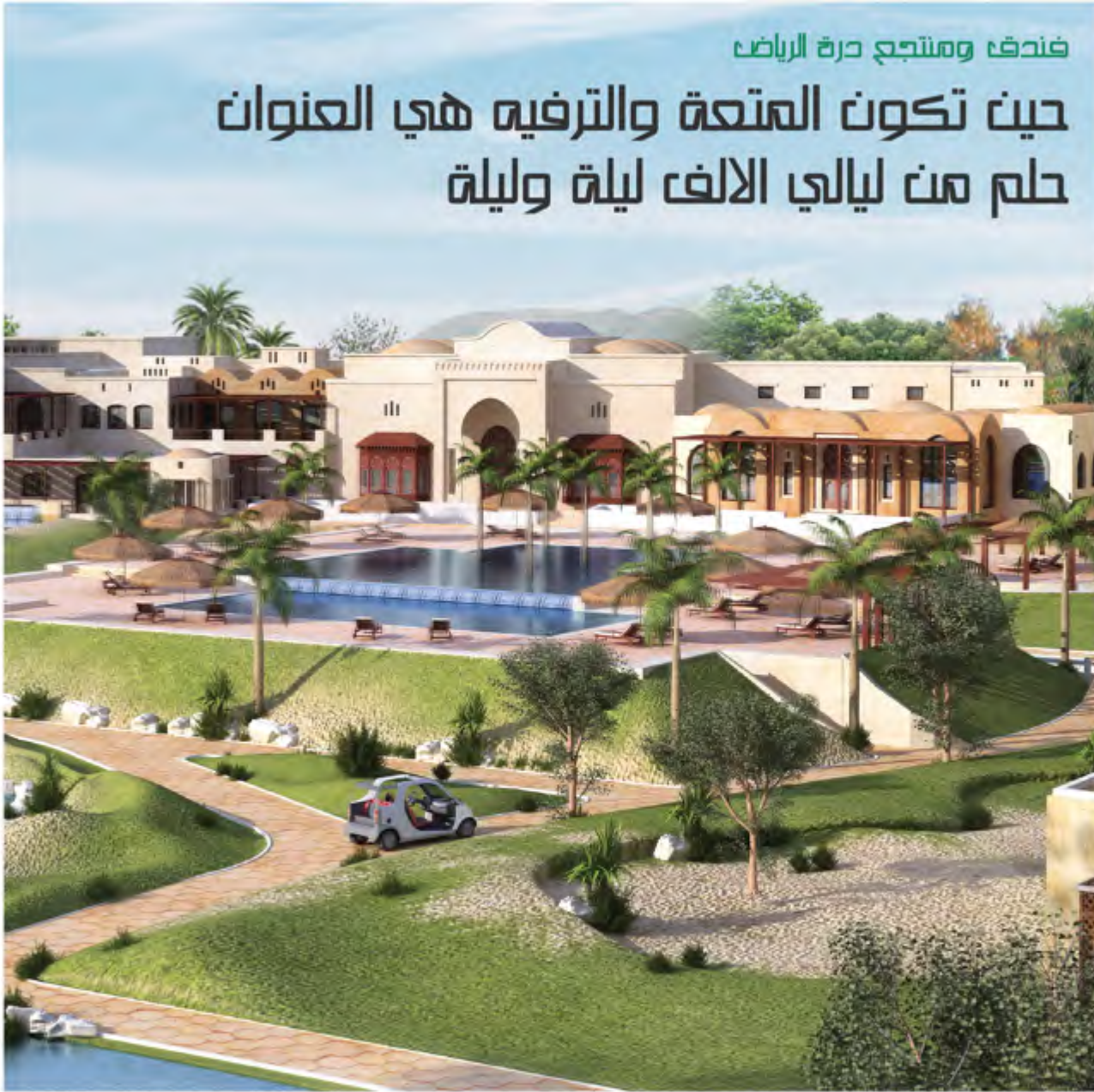
الواجهة الرئيسية للفندق

في قلب «درة الرياض» وعلى أجمل روابيها سيتألق فندق ومنتجع درة الرياض بتصميمه المعماري الفريد على مساحة ١١٤,٠٠٠ متراً مربعاً. ومن المتوقع الانتهاء من تشييده بنهاية ٢٠١١ خصوصاً وأن شركة الخزامي للفنادق تلعب دوراً رئيسياً في تنفيذ المشروع والارتقاء به إلى المستوى العالمي من خلال الاهتمام بأدق التفاصيل.